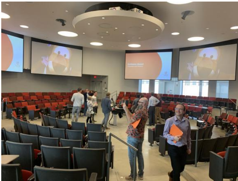
Ronde collegezaal van OSU.

Ondanks dat de conferentie in een andere vorm plaatsvond vanwege de pandemie hebben de 25 deelnemers voor het thema Learning Spaces interessante zaken mee terug genomen. Lees het verslag vanuit SURF (met verwijzing naar andere verslagen) en krijg een indruk van het bijzondere Learning Innovation Center van Oregon State University met hun ronde collegezalen.