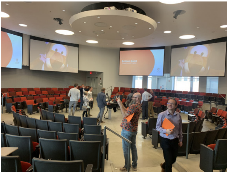
Ronde collegezaal van OSU.

Ondanks dat de conferentie in een andere vorm plaatsvond vanwege de pandemie hebben de 25 deelnemers voor het thema Learning Spaces interessante zaken mee terug genomen. Lees het verslag vanuit SURF (met verwijzing naar andere verslagen) en krijg een indruk van het bijzondere Learning Innovation Center van Oregon State University met hun ronde collegezalen.