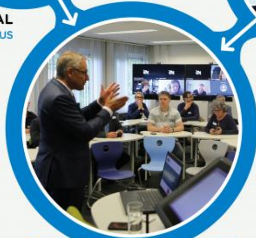
HYBRID CLASSROOM STUDENTEN ON CAMPUS & ONLINE

Onderwijs in deze vorm noemen we Hybride , dual of simultaan onderwijs.