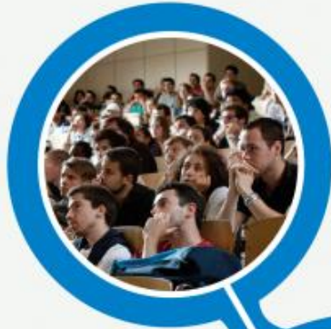
KLASLOKAAL STUDENTEN ON CAMPUS