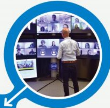
VIRTUAL CLASSROOM STUDENTEN ONLINE